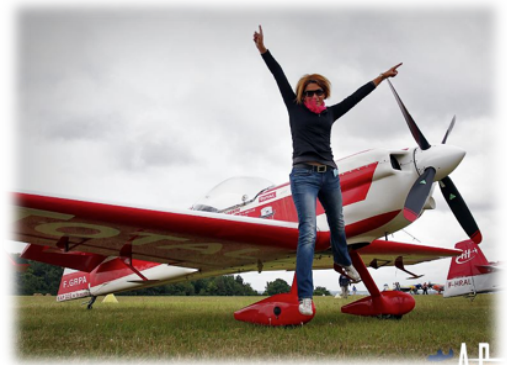
En route vers les championnats du Monde !!!