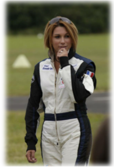
Très heureuse après mon dernier programme

Après l'exécution de 3 programmes sur le Cap 332 rouge et blanc, que j'ai baptisé « Red Beauty » objectif réussi car j'ai terminé avec une moyenne de 70.60% et en prime à la première place, me permettant d'obtenir le titre de Championne de France « Excellence ».