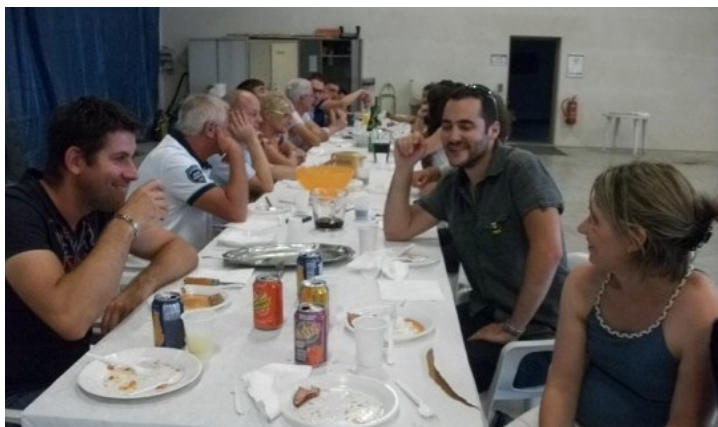
Grenoble Isère Barbecue le 27 juin 2014