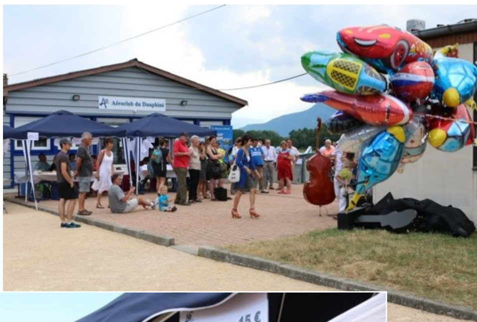
Le Versoud Journées portes ouvertes les 14 et 15 juin 2014