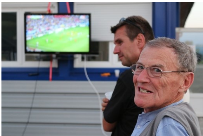
Le Versoud Soirée Paella / Coupe du monde... : 5 à 2 pour la France...! le 20 juin 2014